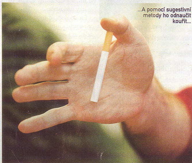
...A pomocí sugestivní metody ho odnaučit kouřit...

nou češtinou, které rozumím jen s obtížemi. Začnu mu popisovat problémy s kouřením. Po dvou větách mě přeruší. Pak už mi skáče do řeči neustále. Znervózním a přestanu mluvit úplně. Nemám vůbec pocit, že bych dobře vysvětlila, oč mi jde. Doktora nezajímá, že kouřím málo, že kouřím jen večer, nezajímá ho, jak kouřím dlouho. Nejsme tu kvůli řečičkám, že jo. „Je to blbost!“ prohlásí po chvíli ticha. „Dneškem